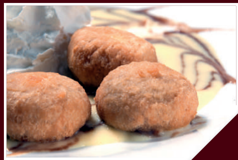
bolitas de coco