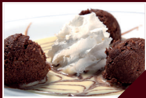
later de cuba