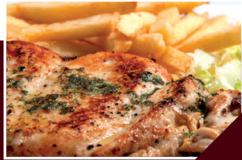
pechuga de pollo

/piščančji fingersi, pommes frites, salsa rosa/