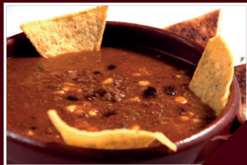
chilli con carne